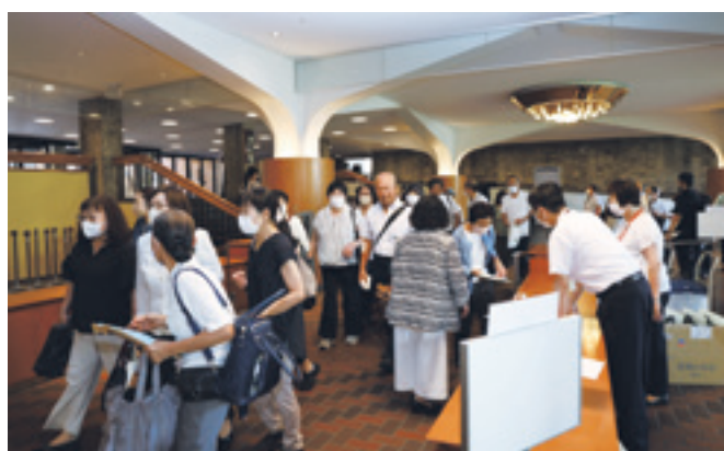
他の市町村委員との再会を喜ぶ姿も見られた入場口

令和4年12月の一斉改 選後の新体制として、ま た新型コロナウイルス感 染症の影響により縮小し ていた開催規模を100 0人規模に戻しての開催 であったため当日は多く の参加者で賑わいました。 今年度から初めての試 みとなる「部会発表」を はじめ、充実した大会の 模様を本誌では写真とと もにご紹介いたします。