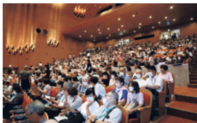
多くの参加者でにぎわう会場