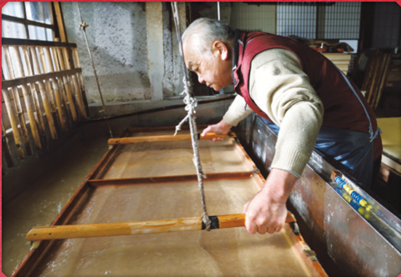
写真/手漉きによる和紙の作成風景（提供：小川町）