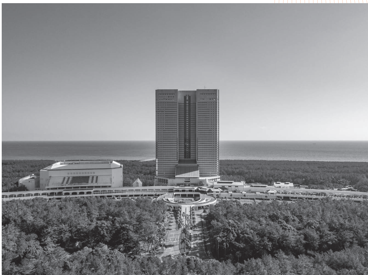
会場：シーガイアコンベンションセンター