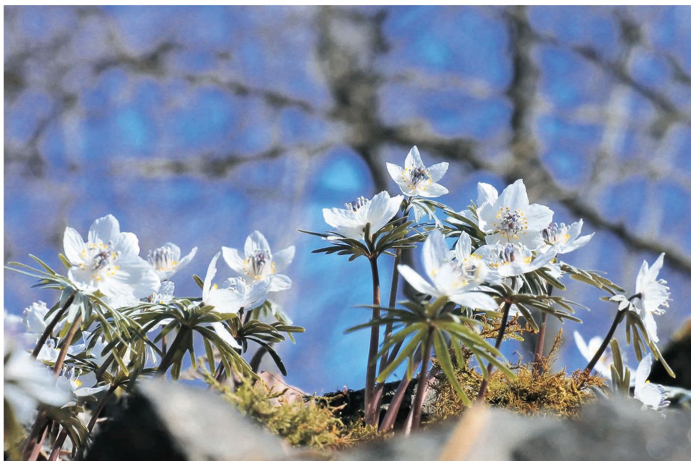
写真／小鹿野町 節分草園